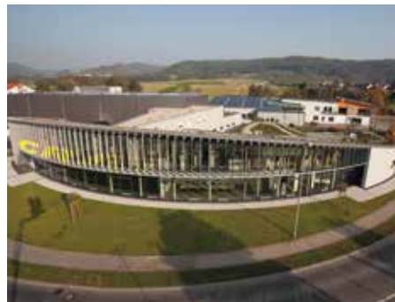
Auf einer Fläche von 6.000 m 2 sind die Bereiche Entwicklung, Vertrieb und Marketing vereint.