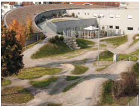
An das Headquarter grenzt der Firmeneigene Bikepark.

Daher verwenden wir ausschließlich und kompromisslos qualitativ hochwertige Materialien und stellen selbst die höchsten Ansprüche an unsere Produkte im Bezug auf Sicherheit, optimale Passform, Belüftung und State of the Art Design.